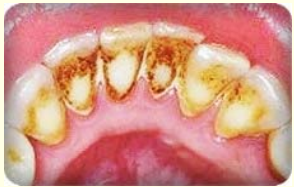
คราบหินปูนบริเวณฟันหน้าล่าง ด้านลิ้น

หินปูนคือภาษาชาวบ้านที่ใช้เรียกคราบแข็งที่ติดตามตัวฟันพบมากและบ่อยในฟันหน้าล่างด้านในมีสีเหลืองน้ำตาลจนถึงดำ มีลักษณะแข็งอาจพบได้ อยู่บริเวณเหนือเหงือกหรือใต้ขอบเหงือก ซึ่งมีความหมายเหมือนหินน้ำลายซึ่งเป็นภาษาทางทันตแพทย์ หินปูนไม่สามารถกำจัดออกโดยการแปรงฟันต้องให้ทันตแพทย์เป็นผู้กำจัดออกให้