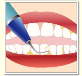
ภาพแสดงการขูดหินปูนโดยใช้เครื่องมือทางทันตกรรม