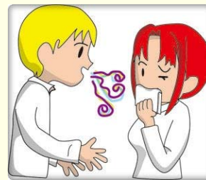
มีกลิ่นปาก !