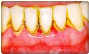
คราบหินปูนบริเวณฟันหน้าล่าง ด้านริมฝีปาก