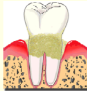
เหงือกอักเสบ

เริ่มแรกจะมีการอักเสบของเหงือกก่อนเพราะหินปูนเป็นที่อยู่อาศัยของเชื้อแบคทีเรียจำนวนมาก เมื่อปล่อยไว้นานเกินไปเชื้อเหล่านี้จะสร้างสารพิษทำอันตรายต่อเหงือกและละลายกระดูกเข้าฟันทำให้โยกมีกลิ่นปากและอาจมีเลือดออกง่ายขณะแปรงฟันได้ บางคนฟันโยกมากเคี้ยวอาหารจะเจ็บสุดทำให้อาจต้องถอนฟันทิ้งไป เราไม่สามารถสร้างกระดูกเข้าฟันให้กลับมาเหมือนเดิมได้เนื่องจากเราเลยวัยเจริญเติบโตไปแล้ว ถ้าไม่รีบป้องกันโรคตั้งแต่วันนี้อาจจะสายเกินไป